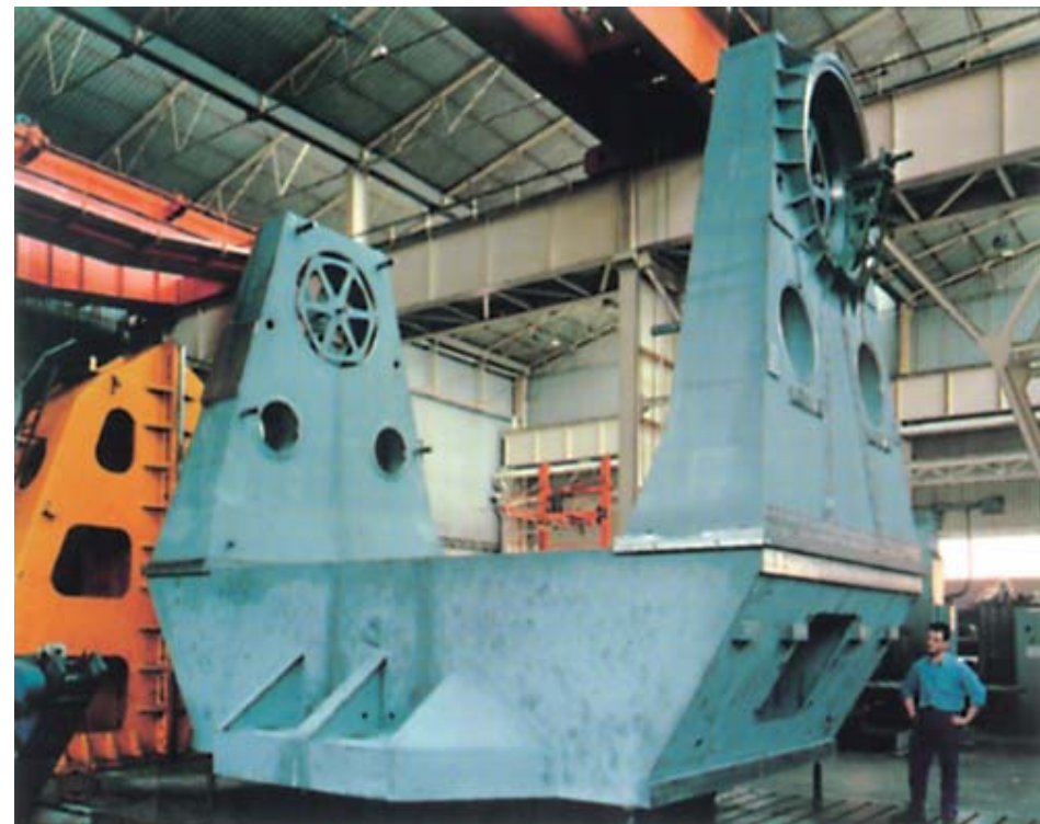
Esempio di componente meccanico