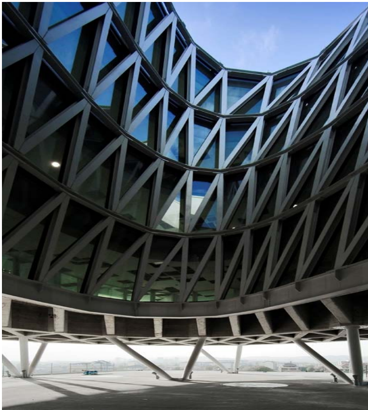
Nuova sede Fater SpA – arch. Massimiliano Fuksas